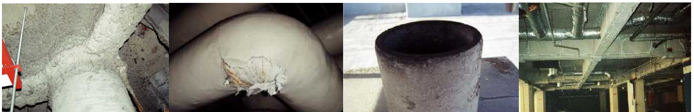
柱や梁に施工 吹付け石綿